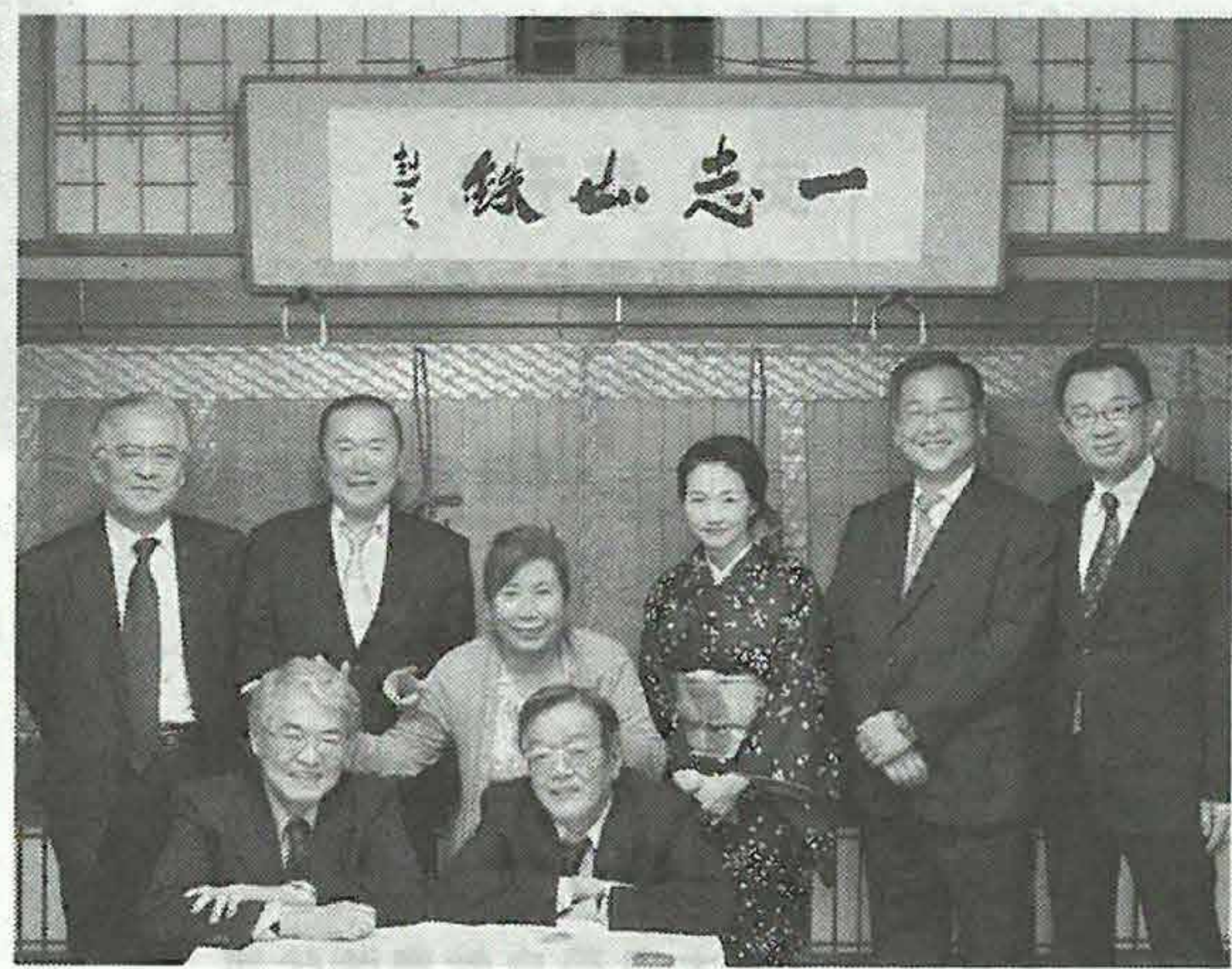
京都で開催した後、懇談会

可欠です。家庭の暖かさは「食」に現れます。毎日作るものだからです。家庭の暖かさ、安らぎを生み出す中心は女性です。女性が作った愛ある食事を通して暖かさや安らぎと応援を受け取り、体と心と魂が養われ、生きていくことができます。食は物質的なものを食べているだけではなく、作り手の心(感謝)と魂(愛)を食べているのだという事です。