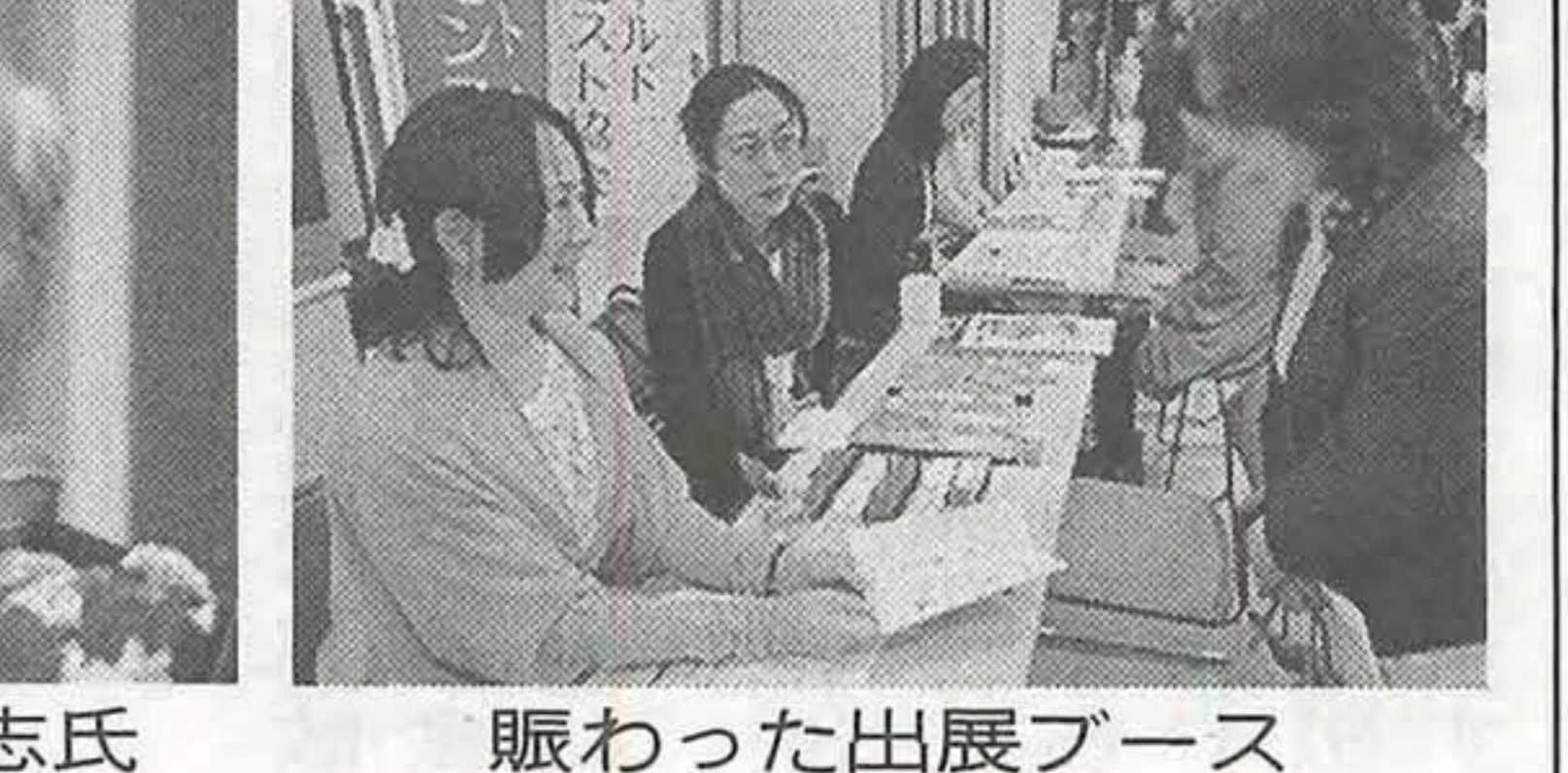
賑わった出展ブース

めぐみ茶、新発売 シンポジウム開催記念 ニッキやへちま、紅花、ダイダイなどが入ったお茶の製品を進め、本日、シンポジウム開催記念として「豊受自然農」の「健康に生きるための食」と題して、シンポジウム会場にて新発売された。