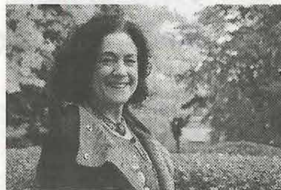
2016年度来賓 ドイツより ロジーナ・ゾンネンシュミット博士

ジョイントカンファレンス開催が決定しています。2016年度のコンgresは、ホメオパシー発祥の国・ドイツから、ロジーナ・ゾンネンシュミット博士の来賓発表、その他にもホメオパシー、インナーチャイルドやフラワーエッセンスの症例発表が行われる予定です。皆様のご来場をお待ち申し上げます。