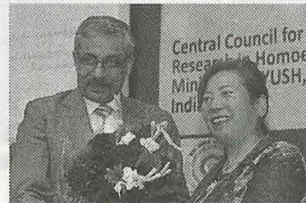
2015年度来賓 インドより 伝統医学省 マンチャダ長官

2015年度の第16回大会では、インド政府伝統医学省からRKマンチャダ長官が来賓として講演いただきました。今年、インド政府の発表したホメオパシーが有効であることを裏付けるリサーチ集の日本語版の共同出版実現。2016年12月には、インド政府からの招聘で南インドにあるホメオパシーリサーチ中央評議会で、日印の