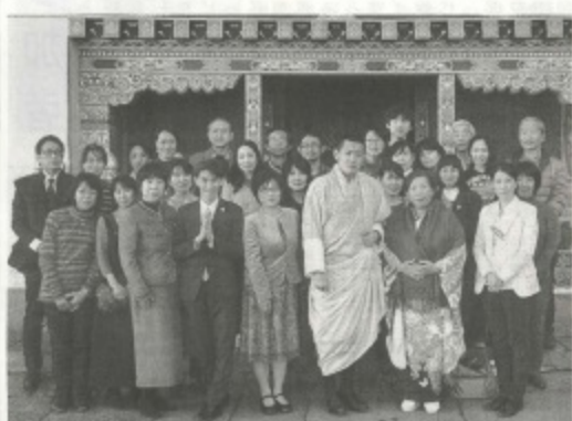
アータンでワンチュク国王陛下下に拜謁し記者撮影におさまる日本ホメオパシー医学協会代表出席